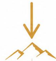
Erscheinung in Herrlichkeit